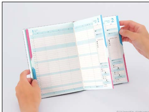
青のインデックスを押さえると 家計簿ページのみが開く