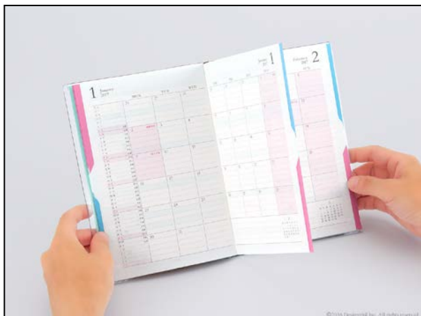
赤のインデックスを押さえると スケジュールページのみが開く