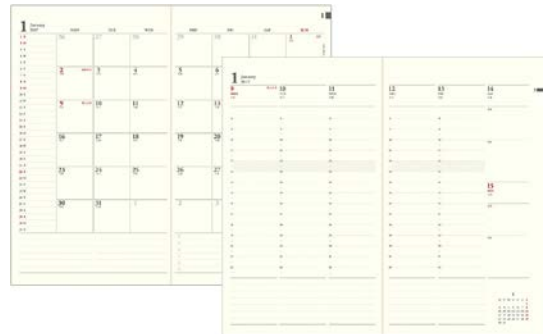
『PRD-8<スリム>』:月間ブロック+週間バーチャル

月間ブロックに時間単位で予定を管理する週間バーチャルが 加わったフォーマット。予定を細かく管理したい方におすすめ。