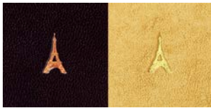
エッフェル塔柄:こげ茶/金