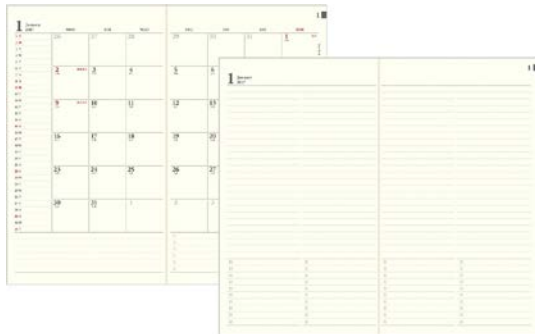
『PRD-3<スリム>』:月間ブロック

1カ月の予定を見渡せる人気の月間ブロック。 月別にメモページ(ToDoリスト付)。