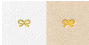
リボン柄:白/ベージュ