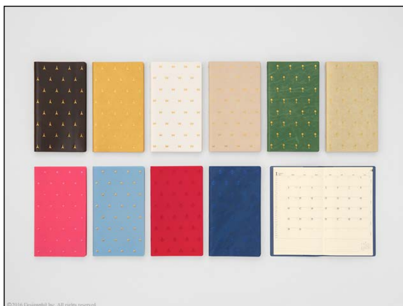
ビジネスシーンを華やかに演出する 2017 年度版「プロフェッショナルダイアリー」限定デザイン登場