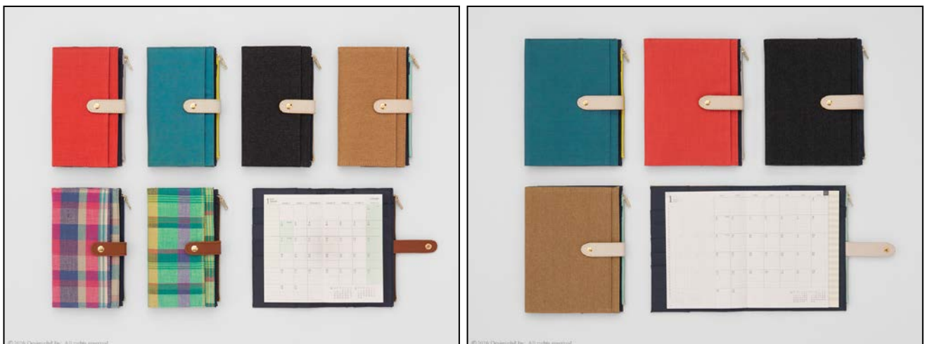
手帳と一緒に持ち歩きたいツールがスッキリ収まる収納力！ ナチュラルな雰囲気の魅力の2017年度版『ポーチダイアリー』

カラーは、ビジネスシーンでも使いやすい6種類を揃えました。リネンは「赤」と「青」、デニムは「黒」に加え、トレンドのアースカラー「ベージュ」が新色として登場します。また、<スリム>サイズの本体カバーには、発色の良さや手織りの柔らかさが特徴のインドの手織り生地を使った「マドラスチェック ピンク」と「マドラスチェック 緑」が仲間入りします。いずれもファスナー部分の生地には、「リネン 赤」には「グレー」、「マドラスチェック ピンク」には「紺」など、本体のカラーと相性がよいカラーを組み合わせアクセントにしました。ラインアップが増え、ファッションや好みに合わせてますます選択の幅が広がります。