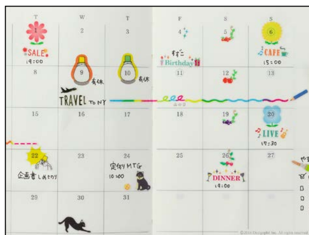
日付や罫線に貼って、大切な予定を目立たせます