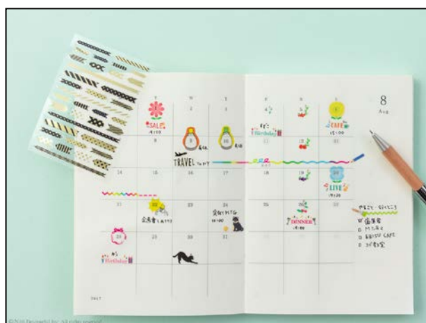
毎日のスケジュールを楽しく管理する『手帳用シール』