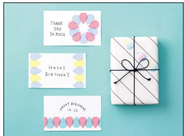
メッセージカードやラッピングのデコレーションとしても。