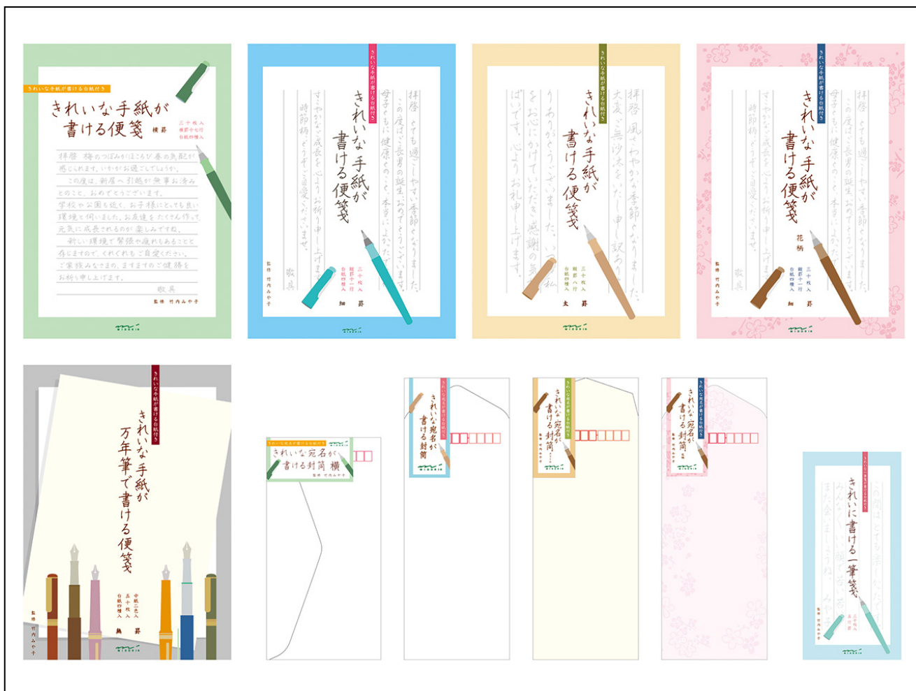
上段左から：『きれいな手紙が書ける便箋』横罫、細罫、太罫、細罫 花柄、 下段左から：『きれいな手紙が万年筆で書ける便箋』、『きれいな宛名が書ける封筒』横、縦、縦 クリーム、縦 花柄、 『きれいに書ける一筆箋』