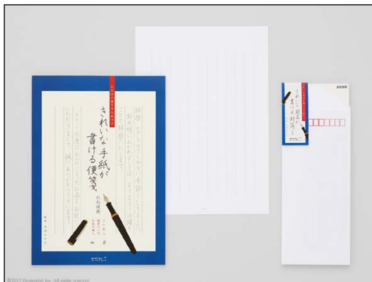
『きれいな手紙が書ける便箋』、『きれいな宛名が書ける封筒』に 「お礼状」専用が新登場！