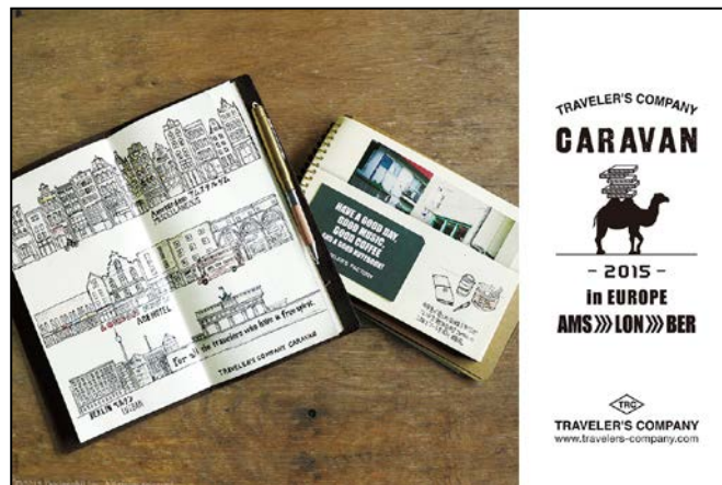
初の欧州キャラバン開催！

イベントには『トラベラーズノート』のクリエイティブスタッフが赴き、欧州のユーザーの皆さまとさまざまな情報交換も行います。