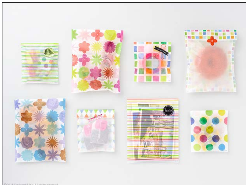
「プチギフト」のためのラッピングアイテムがますます充実！ 『グラシンふくろ』新登場

『ロールシール』は、袋に封をしたり、ラッピングのアクセントになるシールです。今回、新たにさまざまな花の形をダイカットした「花柄」や黒のベースに白文字で「THANK YOU」や「FOR YOU」など、贈り物に添えるのにぴったりなメッセージを入れた黒板風の「メッセージ柄 黒」、細いサイズの「細リボン柄」など、計6柄を展開します。既発売の12柄に加え、さらにバリエーション豊富なデザインが揃いました。