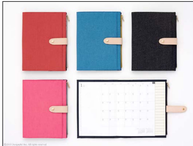
カバー素材はリネンに加えてナチュラルテイストのデニムも登場！ 『ポーチダイアリー』