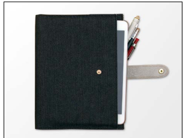
幅広いビジネスシーンで使える タブレット PC も入る抜群の収納力！ 『ポーチダイアリー<A5>』新登場