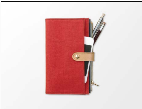
まるで長財布のようにコンパクト スマートフォンの収納にも便利！ 『ポーチダイアリー<スリム>』