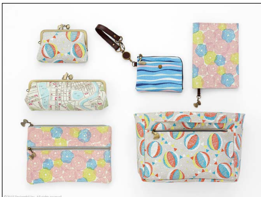
あなたの毎日にお気に入りの小物たちを。「小物雑貨」シリーズ