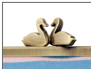
スワン柄 チャーム