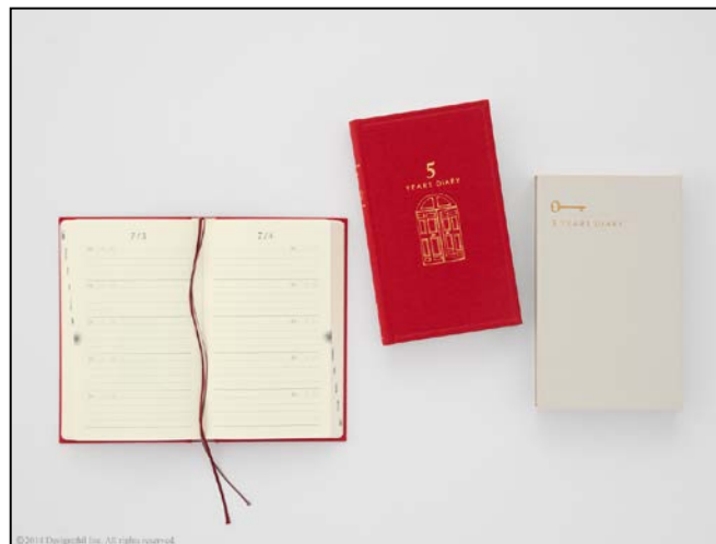
5年連用日記に鮮やかな新色「赤」が登場！