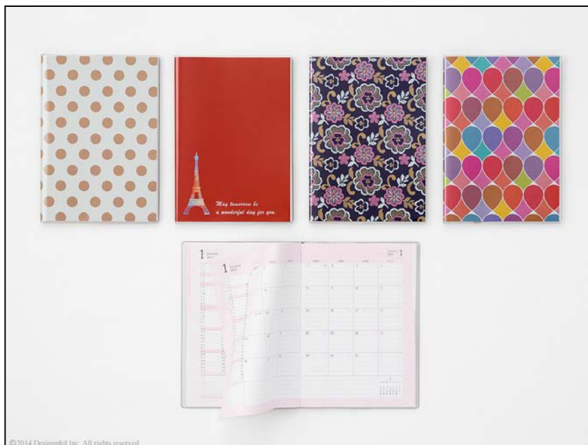
仕事にプライベートに忙しい女性のための手帳 『ダブルスケジュール ダイアリー カジュアル』