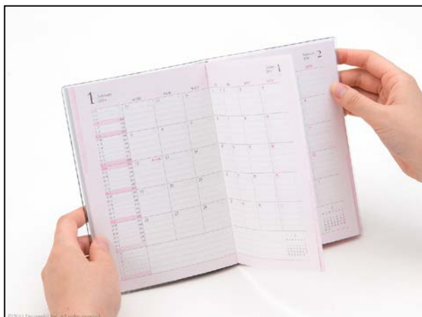
白のインデックスを押さえると白のページのみが開く