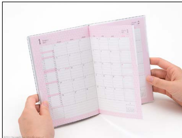
ピンクのインデックスを押さえるとピンクのページのみが開く