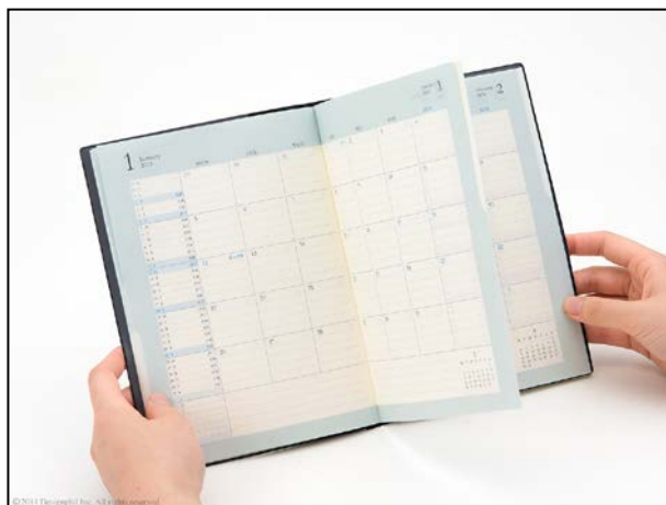
青のインデックスを押さえると青のページのみが開く