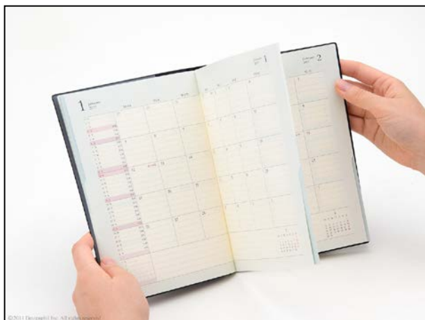
白のインデックスを押さえると白のページのみが開く