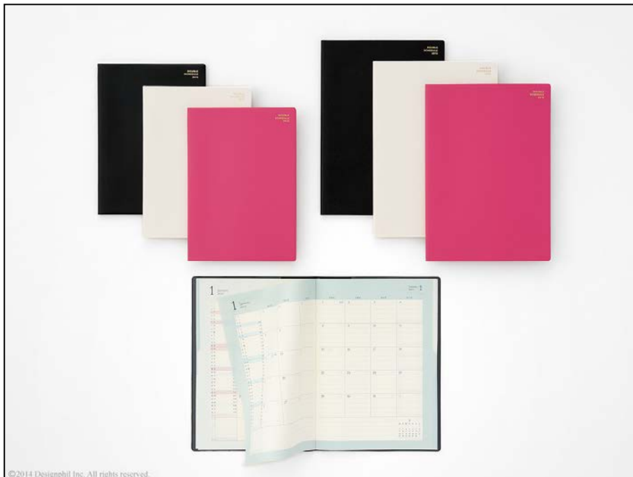
押さえる位置で開くページが変化する『ダブルスケジュールダイアリー』