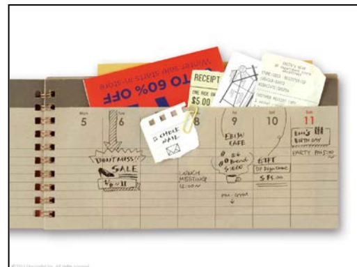
保管した物の内容に合わせて使える 「見開き2週間」タイプのフォーマット