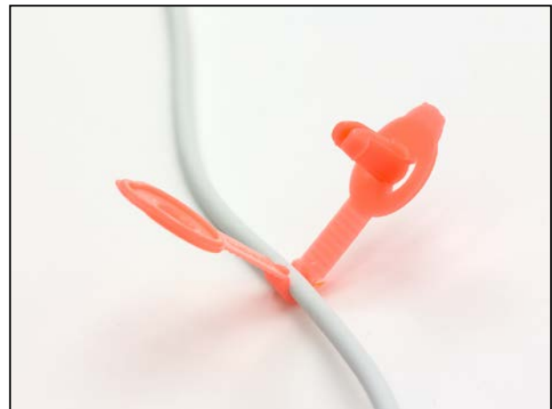
細径コード本体に固定できるくぼみ