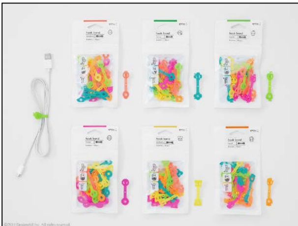
いろいろ使える便利なバンド『ホックバンド』