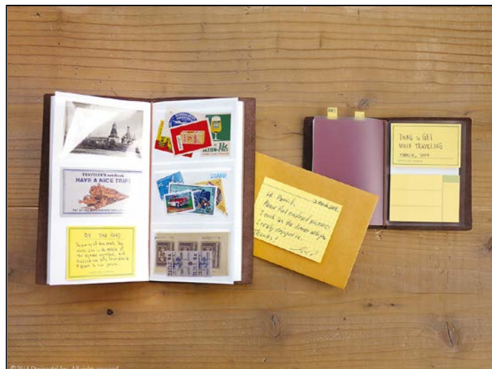
『トラベラーズノート リフィル』に新アイテム登場！