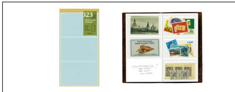
『フィルムポケットシール』