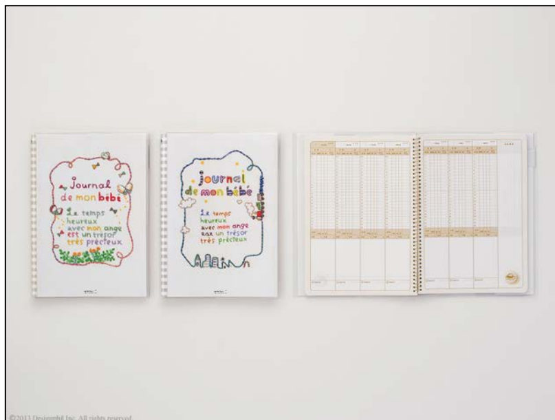
成長の様子を毎日記録できる『育児ダイアリー<B5>』