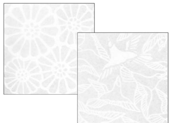
吉祥文様「八重菊」と「都鳥」のデザインを特殊な加工により半透明に