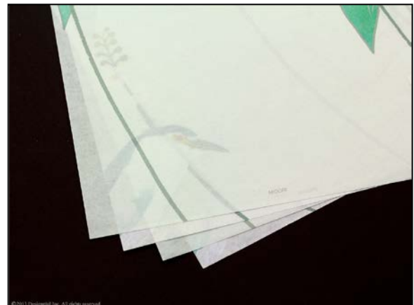
書き心地にもこだわった和紙のようなやわらかな透け感の紙