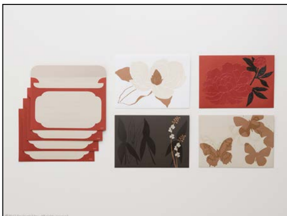
「うすぎぬ便箋」をしまう文箱をイメージした『漆封筒』

『漆封筒』は、光を吸い込むような独特な深い艶を持つ漆を、透明UVシルク印刷という手法で再現した封筒です。『うすぎぬ便箋』を漆の文箱にしまう見立てでデザインを施した、便箋と揃えの4柄展開。裏面には宛名の枠を寺院建築などに見られる花頭窓をイメージしたデザインで表現しています。本製品は郵送用としてもご使用いただけます。