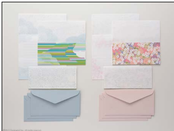
おめでたいシーンでもお使いいただけるカードタイプのレターセット

『型紙』は、おめでたいシーンでも使用される吉祥文様の「八重菊」と「都鳥」をモチーフに採用したカードタイプのレターセットです。着物の染色に用いる型紙をイメージし、熱と圧力を加えた部分だけが半透明に変化する特殊な厚手の紙で再現しました。3つ折りにすると、半透明に透けた紙はすりガラスのように下の紙の色柄を淡く透過させます。その様子が、欄間越しに見える美しい景色を思わせるような華やかなアイテムです。それぞれのデザインに合わせた色合いの封筒がセットになっており、郵送用としてもご使用いただけます。(※2)