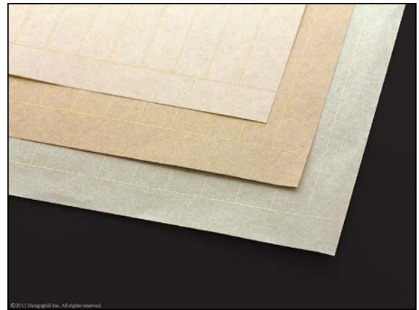
金泥をイメージした、文字を引き立てる金色の線