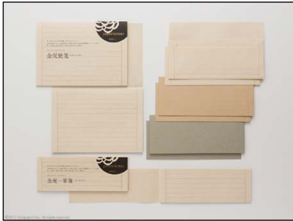
料紙をイメージした、落ち着いた風合いの3色の紙をセット

金泥は古くから日本の書画に用いられてきた顔料です。本製品は平安時代の国宝「彩箋墨書」からイメージを得て金色の線で金泥を表現し、歌や書をしたためるために染められた美しい色柄の紙「料紙」を3色の落ち着いた風合いの紙で再現したアイテムです。金色の線は目立ちすぎることなく、墨文字や黒いペン、万年筆の文字を美しく引き立てます。また、ラインアップには縦横両用タイプの便箋、封筒、一筆箋の3種を揃えました。静かで穏やかな日本の美をたたえるデザインで、お礼状やビジネスシーンなどでもお使いいただけます。