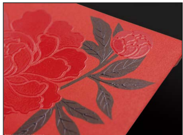
絵柄の部分に艶のある厚みをもたせ、漆を表現