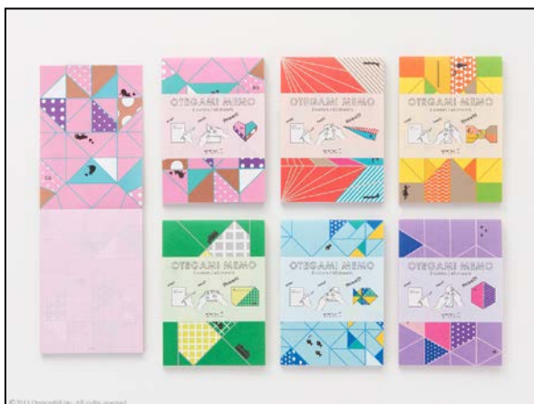
折り紙のように折って渡すメッセージ・メモ