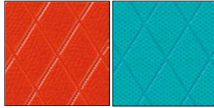
格子柄:オレンジ/水色