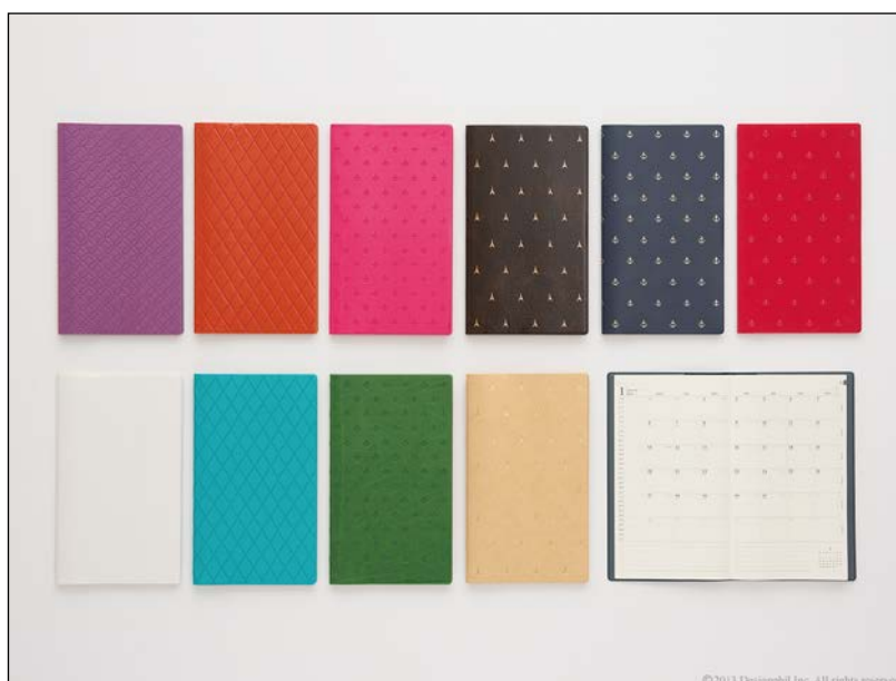
ビジネスシーンに彩りを添える華やかなラインアップ