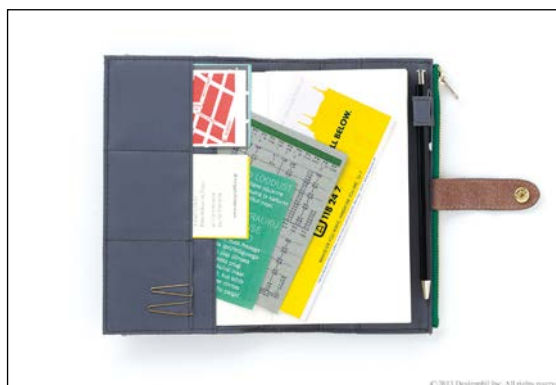
必要なものがすっきり入る充実した収納力