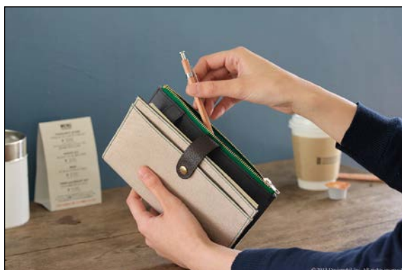
女性の手になじみやすいウォレットサイズ