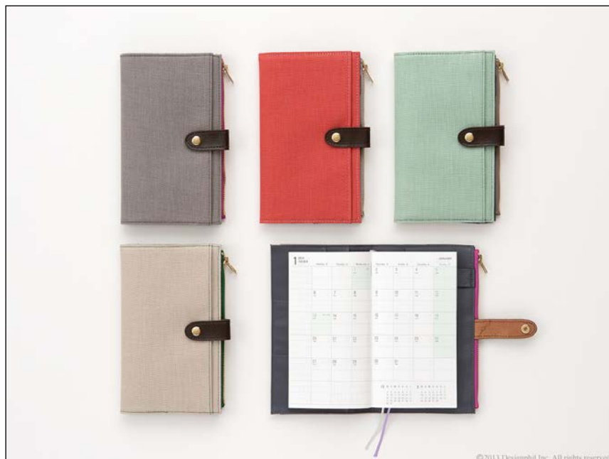
ナチュラルなリネン素材でおしゃれに持ち歩ける『ポーチダイアリー』