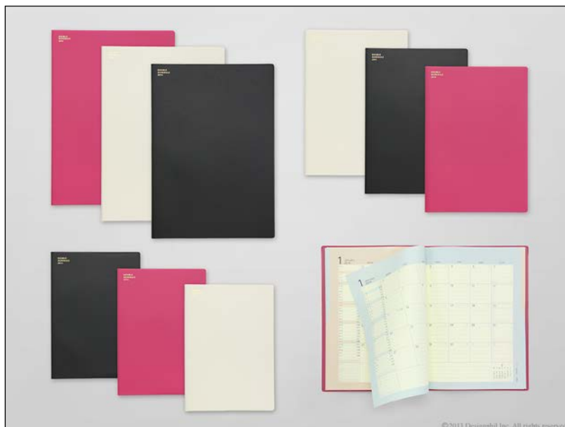
押さえる位置で開くページが変化する『ダブルスケジュールダイアリー』