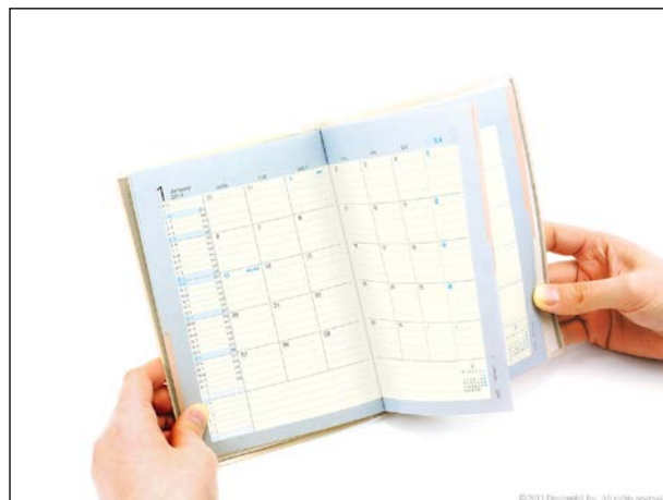
青のインデックスを押さえると青のページのみが開く