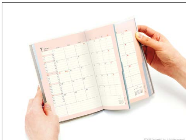
赤のインデックスを押さえると赤のページのみが開く