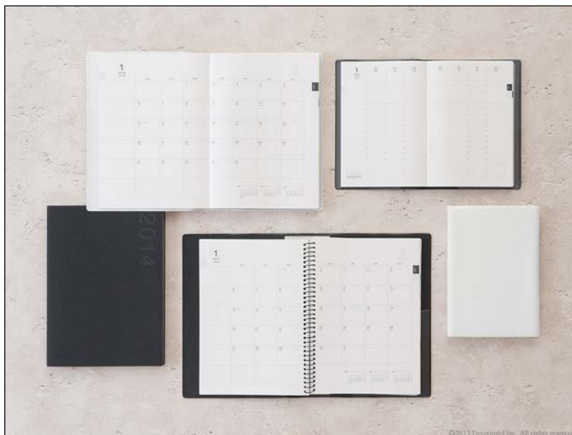
ビジネスに最適なサイズとフォーマットを追求したダイアリー