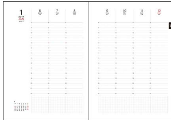
時系列でスケジュールチェックできる「週間バーチャル」