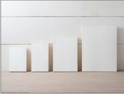
『MD ノート コットン』

「書く」ための紙として、ハイクオリティを追求。手触りや書く音など、五感を刺激するノートです。