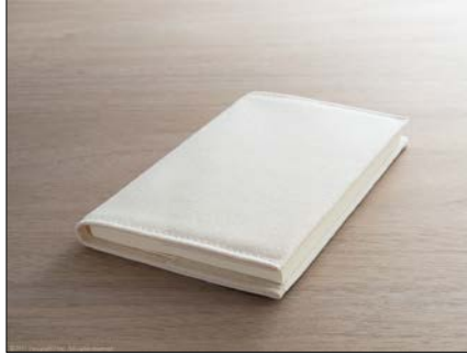
『MD ノートカバー 倉敷帆布』

「書く」ための紙として、ハイクオリティを追求。手触りや書く音など、五感を刺激するノートです。