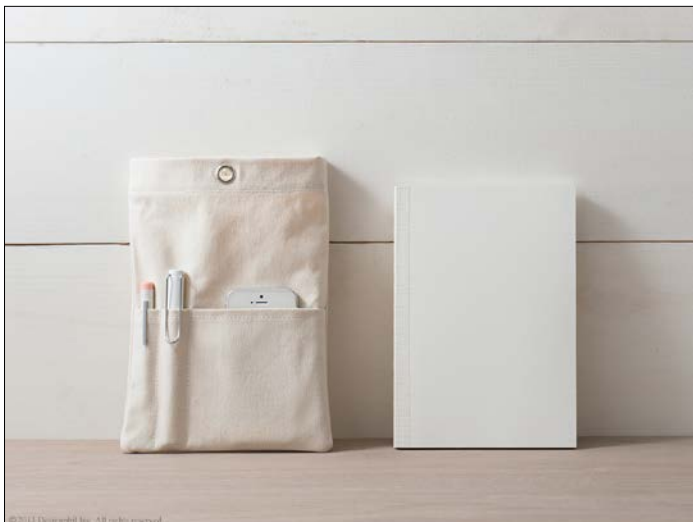
素材をそっと閉じ込めた無垢な倉敷帆布と特別なコットンペーパー。書くことをより楽しめる限定アイテムです。