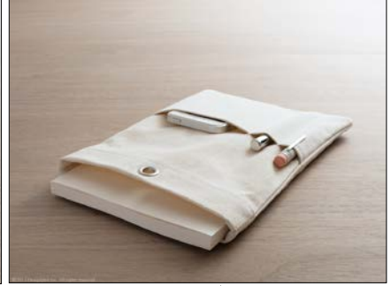
『MD ノートバッグ 倉敷帆布』

国産の無垢な帆布を用いた、特別なノートに似合うカバーです。素のままの素材感を楽しめます。