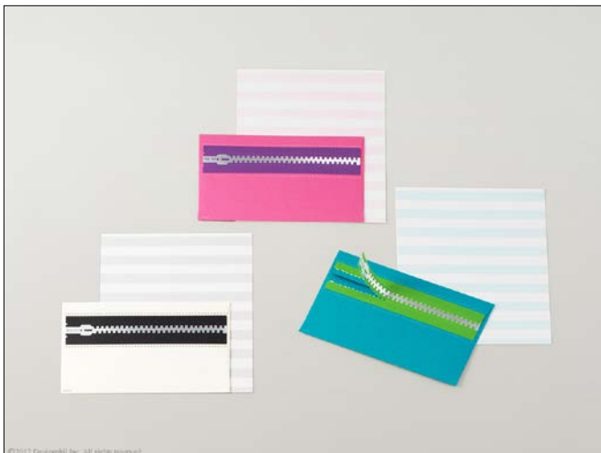
開封時の「ピリピリッ」が楽しい、ポップなレターセット