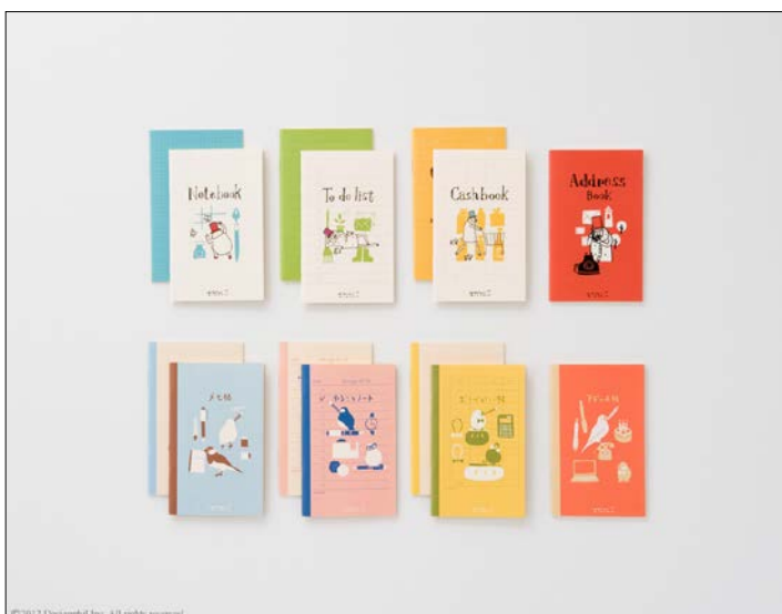
手のひらほどの<ミニ>サイズは、足りない機能を補うのにぴったりのコンパクトサイズ。