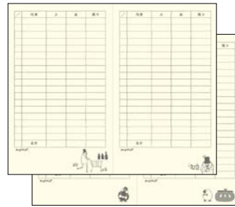
＜キャッシュブック＞