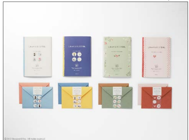
ラッキーモチーフで気持ちを伝える便箋が新登場！