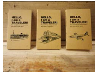
海外イベント初上陸記念アイテム 『プラス プロダクト ボールペン』と『スパイラルリングノート』(3 種)