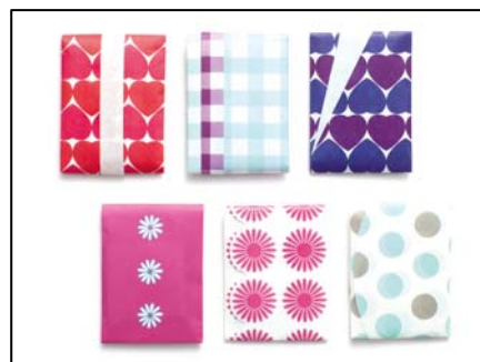
たとう折りでぼち袋に