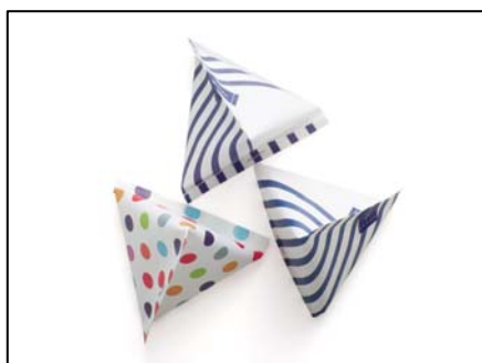
テトラ(三角)折りでおすそわけに