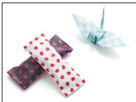
お土産などのちょっとしたプレゼントに