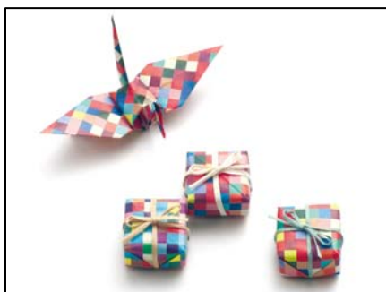
プチギフトのラッピングに