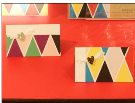
シールと組み合わせてカード作り