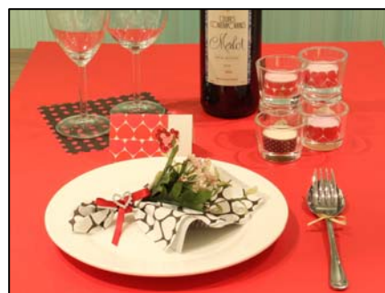
テーブルコーディネートにも