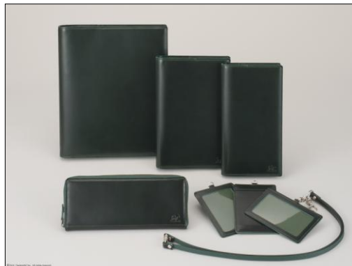
落ち着いた印象のグリーン