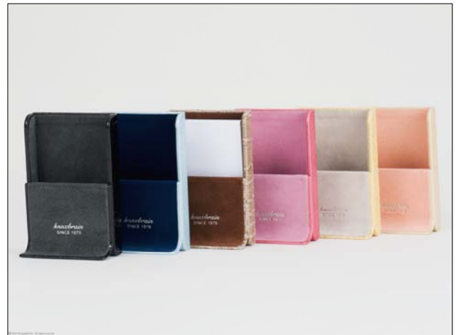
ギフトにもぴったり！デスクを彩る“立つペンケース&カードケース”