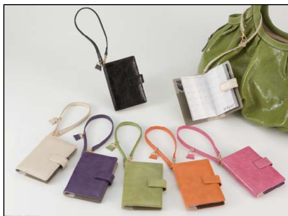
元気の出るハッピーカラーを揃えました。 『ハンドルストラップダイアリー』

ダイアリーは月間ブロックとセクションのメモページを収録。ニューヨークの摩天楼をイメージしたデザインで、スタイリッシュに仕上げました。カラーは黒、黄緑、ピンク、紫、オレンジ、アイボリーの 6 色。気持ちがポジティブになる鮮やかな発色と、シワ加工・パール加工を施した本革の艶感が魅力です。プライベートの予定はもちろん、ビジネス用としてもお使いいただける上品なダイアリーです。