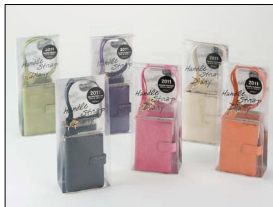
ファッションアイテムのようなパッケージ。 ギフトにもおすすめ！