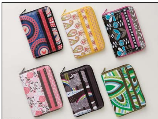
カラフル&レトロな6デザイン

ダイアリーは月間ブロックと週間水平の2種類を収録し、スケジュールもたっぷり書き込めます。週間スケジュールページは、右側に可愛いピンクのセクション罫メモページを収録しました。