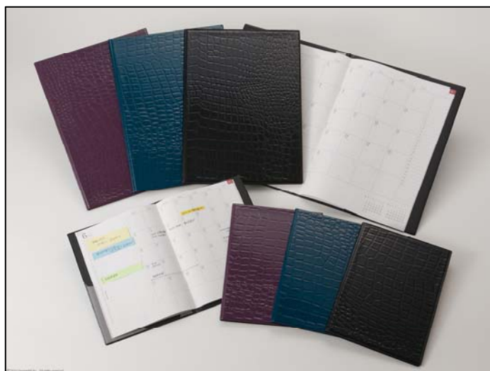
たっぷり書いて、書類も挟める 『フラットファイルダイアリー』

社内・社外会議で資料を持ち歩くことが多い方、また、付せんを多用したスケジュール管理をされる方にぴったりのダイアリーです。