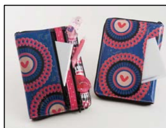
表紙・裏面・中面に計8つのポケットが！